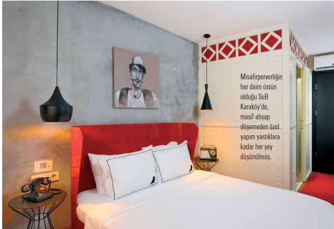
Misafirperverliğin her daim üstün olduğu SuB Karaköy'de, masif ahşap döşemeden özel yapım yastıklara kadar her şey düşünülmüş.