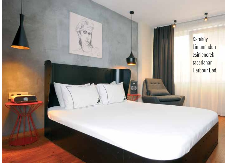
Karaköy Limanı'ndan esinlenerek tasarlanan Harbour Bed.

SuB Hotel Karaköy; Necatibey Cad., 91, Karaköy, İst. Tel: (0212) 243 00 05. www.subkarakoy.com